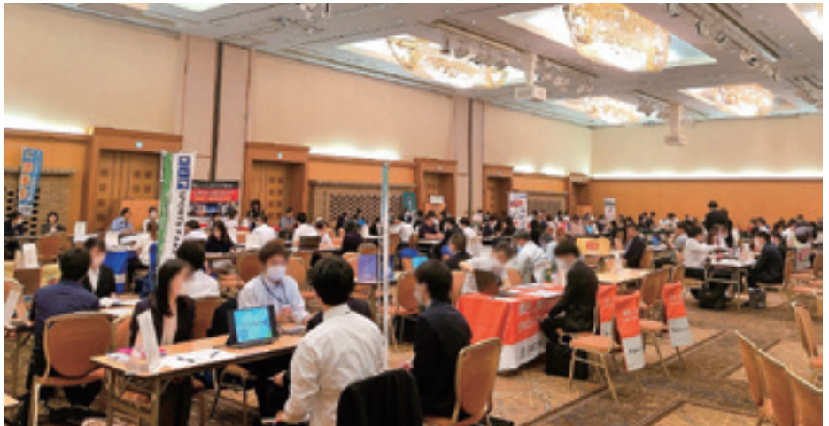
チャレンジいばらき就職フェア（水戸会場）の様子 県内各地で「就職面接会」を開催しています。詳しくは中面をご覧ください。